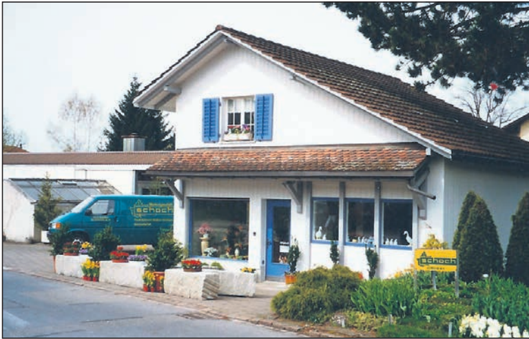
Aus einem alten Schopf entstand dieser hübsche Laden.