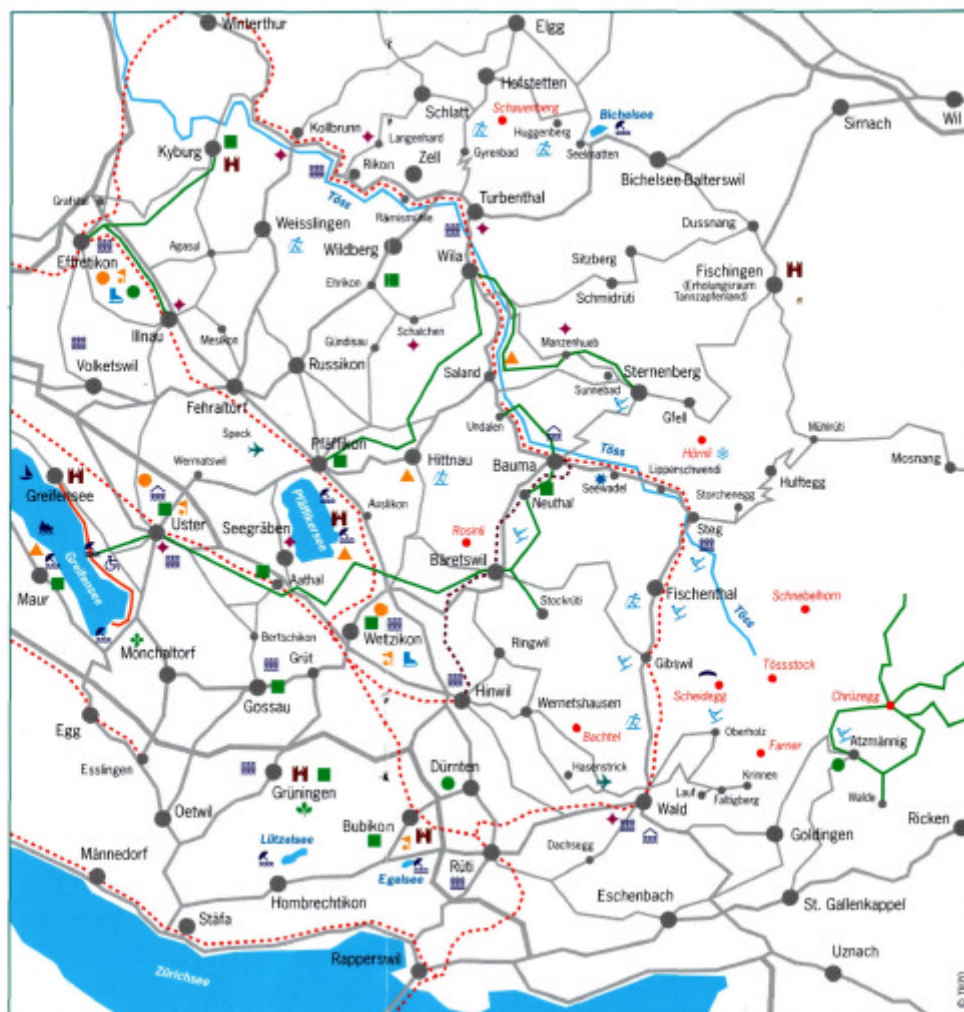
Karte aus ZüriOberland – Viel Vergnügen – 2002/2003 www.trzo.ch